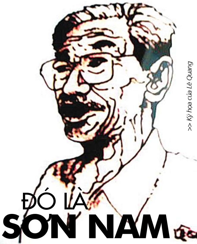
>> Ký họa của Lê Quang