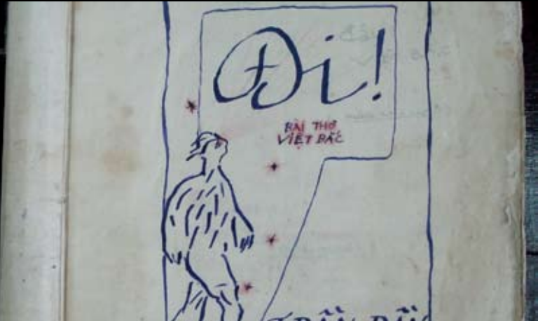
>> Trần Dần – Thơ (Công ty Văn hóa Truyền thông Nhã Nam và Nxb Đà Nẵng, xuất bản quý I/2008). Giải thưởng Thành tựu trọn đời về thơ năm 2008 của Hội Nhà văn Hà Nội

“Trao giải này nghĩa là chúng tôi đánh giá rất cao sự tận hiến cho thơ, sự sáng tạo và cách tận quyết liệt cho thơ. Trần Dần và bạn bè ông trong hoàn cảnh chiến tranh không có điều kiện tiếp xúc với các nhà thơ thế giới cùng thời, nhưng bằng quyết tâm đổi mới, cách tân, bằng tài năng và nghị lực, thơ ông đã có nhiều điểm tiếp cận với thơ hiện đại thế giới. Đây tới tận cùng sẽ gặp nhân loại là như thế. Trần Dần đã đi vào khai thác sạch các con chữ con âm, bỏ hết nghĩa tự vị vốn có của chúng, đặt chúng vào ngữ cảnh mới và tạo cho chúng những nghĩa mới. Cho nên, tập Trần Dần – Thơ này cũng như các tập khác sẽ con gây hấn, thách thức với độc giả”.