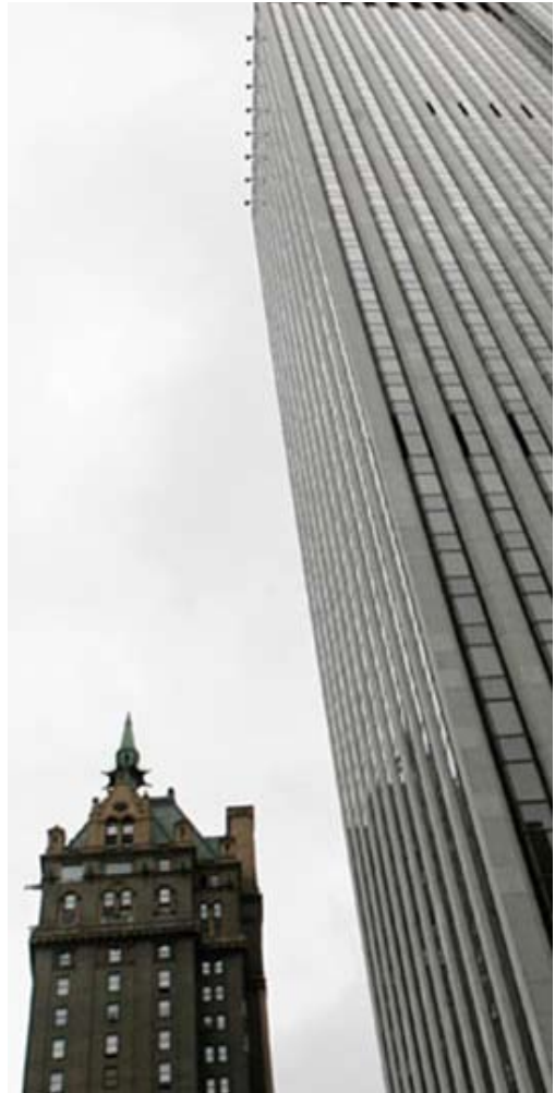
>> General Motors Building: Tòa nhà chọc trời này ở Midtown Manhattan có địa chỉ rất phổ biến ở New York: Đại lộ số 5 giữa phố thứ 57 và 58.