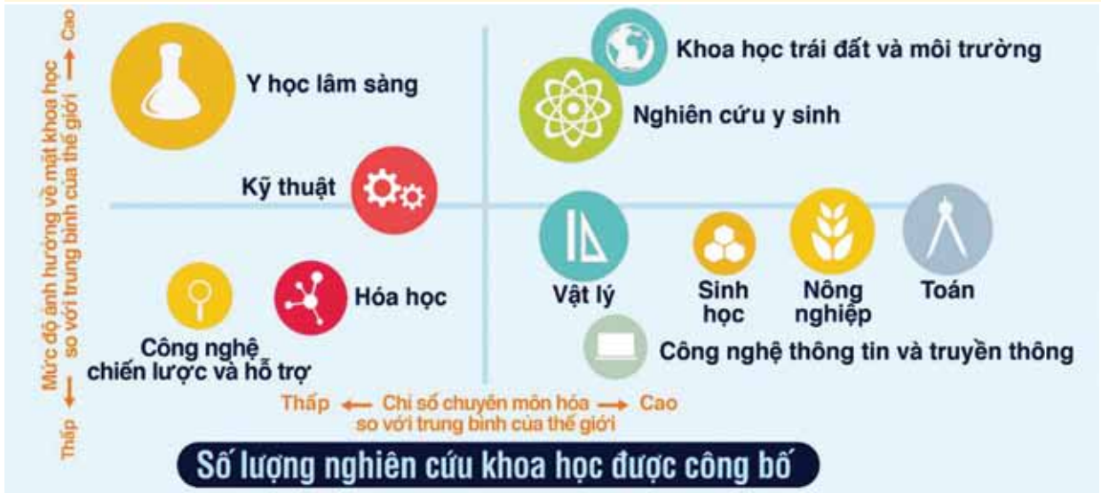
Tình hình và chất lượng nghiên cứu khoa học được công bố của Việt Nam