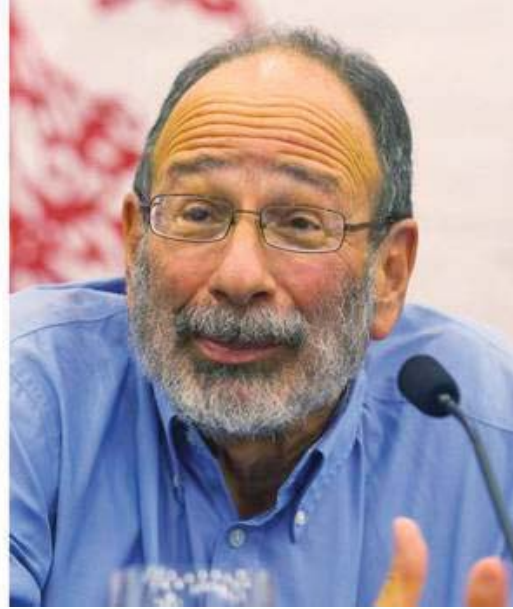
GS. Lloyd S. Shapley và GS. Alvin E. Roth