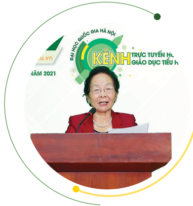
CHỦ TỊCH HỘI KHUYẾN HỌC VIỆT NAM NGUYỄN THỊ DOAN

Kênh trực tuyến hỗ trợ giáo dục tiểu học được phát triển trên tinh thần