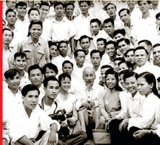
Chủ tịch Hồ Chí Minh nói chuyện với các nhà báo, tháng 9/1960.

CHỦ TỊCH HỒ CHÍ MINH LÀ NGƯỜI VIỆT NAM ĐẦU TIÊN SỬ DỤNG BÁO CHÍ NHƯ MỘT VŨ KHÍ SẮC BÉN VÀ CÓ HIỆU LỰC TO LỚN TRONG SỰ NGHIỆP ĐẤU TRANH GIẢI PHÓNG DÂN TỘC VÀ XÂY DỰNG ĐẤT NƯỚC. NGƯỜI ĐÃ KHAI SINH NỀN BÁO CHÍ CÁCH MẠNG VIỆT NAM, ĐỒNG THỜI CŨNG LÀ NGƯỜI CHIẾN SĨ TIÊN PHONG TRÊN MẶT TRẬN NÀY. LÀ NGƯỜI LÃNH ĐẠO CỦA CÁCH MẠNG, CỦA ĐẢNG, ĐỒNG THỜI NGUYỄN ÁI QUỐC - HỒ CHÍ MINH LÀ MỘT NHÀ BÁO LỚN. NGƯỜI LÀ NGƯỜI THẦY, NGƯỜI ANH CỦA NHIỀU THẾ HỆ NHÀ BÁO. ẢNH HƯỞNG CỦA NGƯỜI, NGAY TỪ ĐẦU NHỮNG NĂM 20 CỦA THẾ KỶ XX, ĐÃ GÓP PHẦN TO LỚN TRONG VIỆC HÌNH THÀNH VÀ PHÁT TRIỂN NỀN BÁO CHÍ CÁCH MẠNG VIỆT NAM.